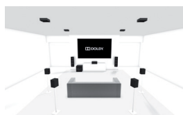
7.1.4: Configuración regular 7.1 con 4 altavoces de techo o 4 habilitados para Dolby