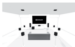
9.1.2: Configuración regular 9.1 con 2 altavoces de techo o 2 habilitados para Dolby