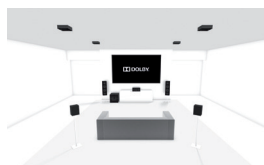
5.1.4: Configuración regular 5.1 con 4 altavoces de techo o 4 habilitados para Dolby