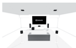
5.1.2: Configuración regular 5.1 con 2 altavoces de techo o 2 habilitados para Dolby