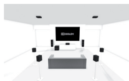
7.1.2: Configuración regular 7.1 con 2 altavoces de techo o 2 habilitados para Dolby